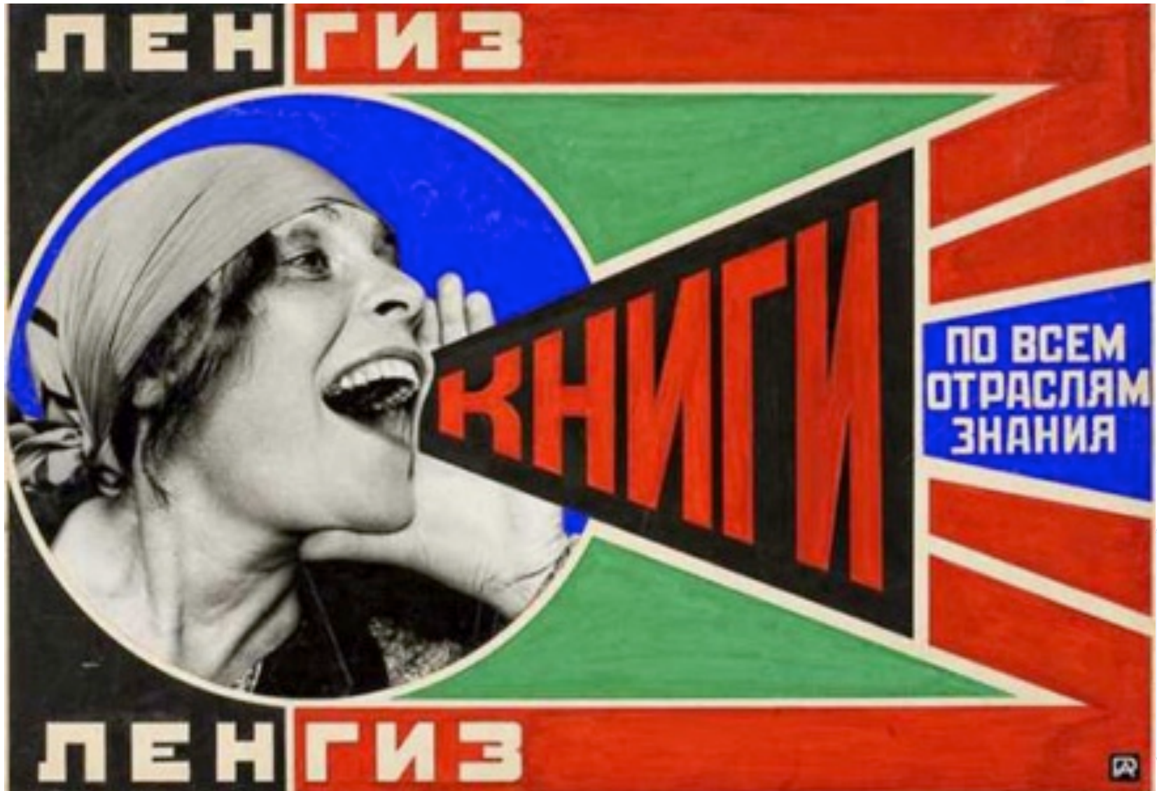
Alexandre Rodchenko, Affiche pour les éditions Lenguiz (1925)

Mir@bel, un réseau à faire connaître. Qu'on se le dise !